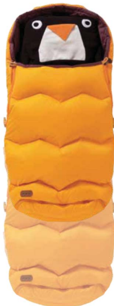
Верхний слой с пухом в двух размерах