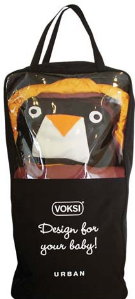
Конверт по индивидуальному заказу