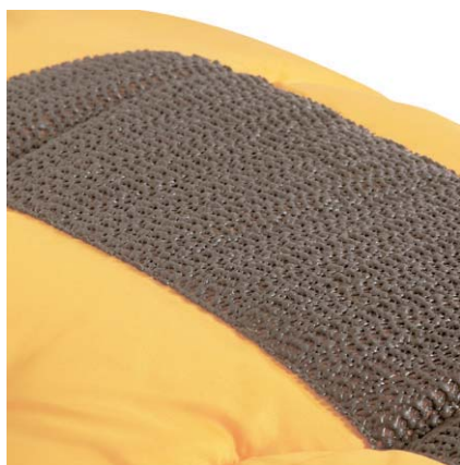
Противоскользящие накладки на дне конверта