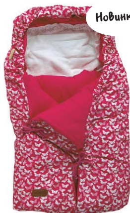
Retro Розовый 3020221