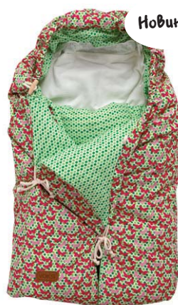
Retro зеленый 3020222