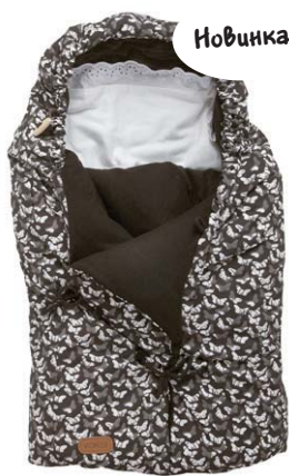
Retro черный 3020220