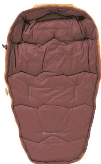
Дно конверта из натуральной шерсти