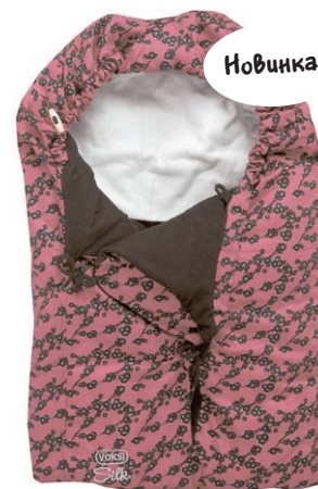
Blossom Коричневый 3108205 Mini: 3128205