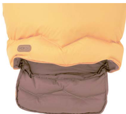
Отверстие для ног