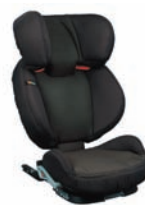
Car Interior 46