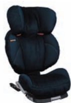
Navy Blue 53