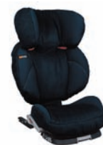
Mood Indigo 66