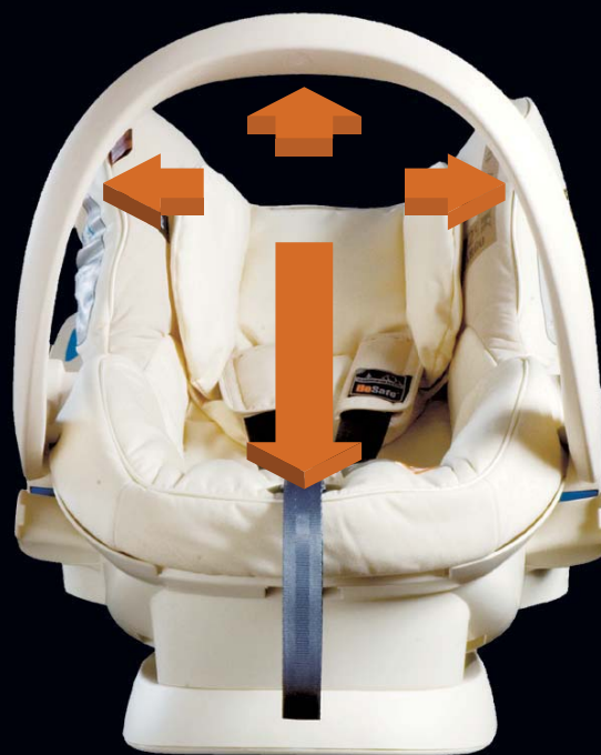
Больше других детских сидений